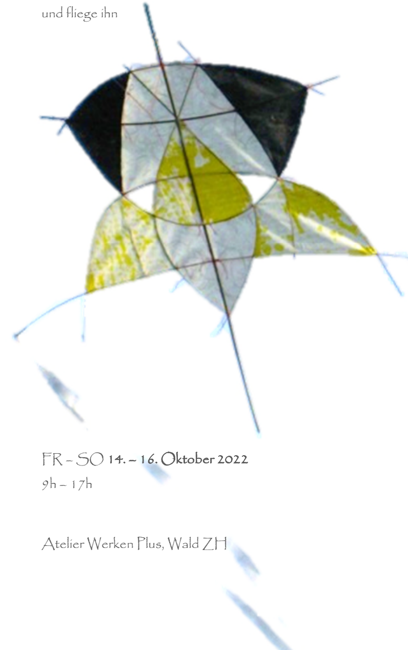
Bilder: Drachen von Kursteilnehmenden